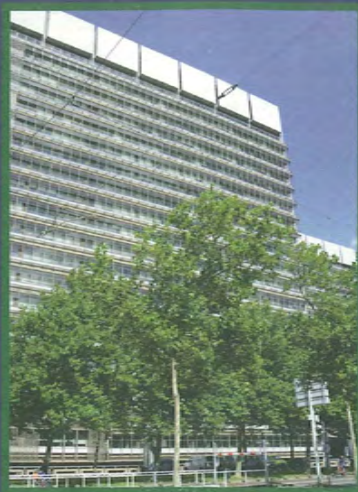
Ministerie van Veiligheid en Justitie Schedeldoekshaven 100, Den Haag (1979 - 2012)