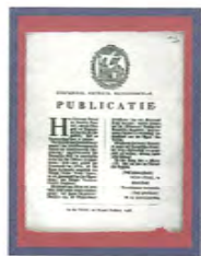
Publicatie Departement Justitie (1798)