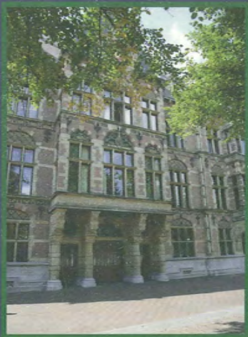
Ministerie van Justitie Plein 2, Den Haag (1823 - 1979)